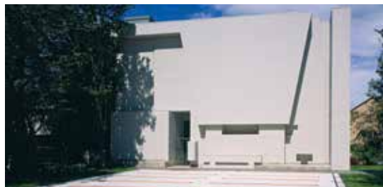
Gestaltungspreis 2010 Biohotel, Kranzberg-Hohenbercha Deppisch Architekten, Freising